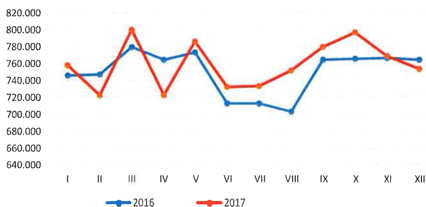
KRETANJE OSTVARENJA REDOVNIH KILOMETARA ZA 2016. I 2017. GODINU